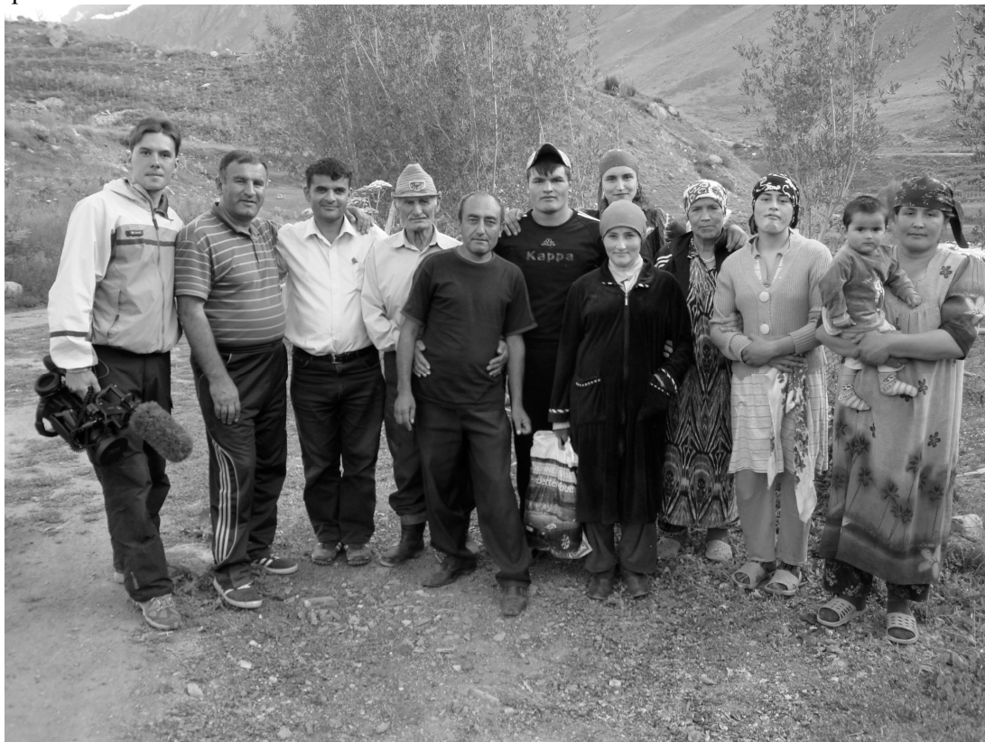
Рис. 2. Автор статьи (слева) в киноэкспедиции. Памир, 2009

Подробнее изучить охарактеризованный «метод Ерофеева» автору настоящей статьи удалось благодаря проведению собственного киноисследования в ходе киноэкспедиции к таджикам Памира.